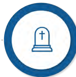
Ajutorul pentru înmormântare