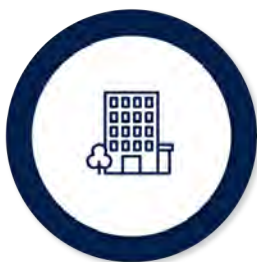
Asigurarea obligatorie pentru locuință

În funcție de nevoile familiei/persoanei singure, venitul minim de incluziune este însoțit de alte drepturi complementare, plătite de la bugetul de stat sau după caz, din bugetul local: