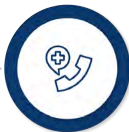
Ajutoarele de urgență (de la bugetul de stat și de la bugetul local)